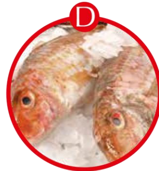
D FÜR FISCH UND DARAUS GEWONNENE ERZEUGNISSE (AUSSER FISCHGELATINE)

Eierteigwaren, panierte Speisen, Mayonnaise, Palatschinken, Kuchen, Gebäck, Brot, Nudeln, Croutons, Faschierter Braten, Burger, Feinkostsalate, Pasteten, Quiches, Soßen, Dressings, Desserts