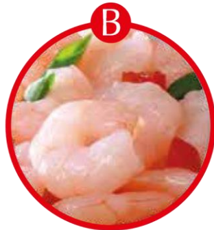
B FÜR KREBSTIERE UND DARAUS GEWONNENE ERZEUGNISSE

Brot und Gebäck, Kuchen, Teigwaren, Suppen, Soßen, Paniermehl, Semmelbrösel, Wurstwaren, Backerbsen, Frischkornbreie, Desserts, Schokolade