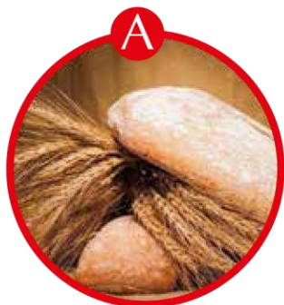
A FÜR GLUTENHALTIGES GETREIDE UND DARAUS GEWONNENE ERZEUGNISSE

Brot und Gebäck, Kuchen, Teigwaren, Suppen, Soßen, Paniermehl, Semmelbrösel, Wurstwaren, Backerbsen, Frischkornbreie, Desserts, Schokolade